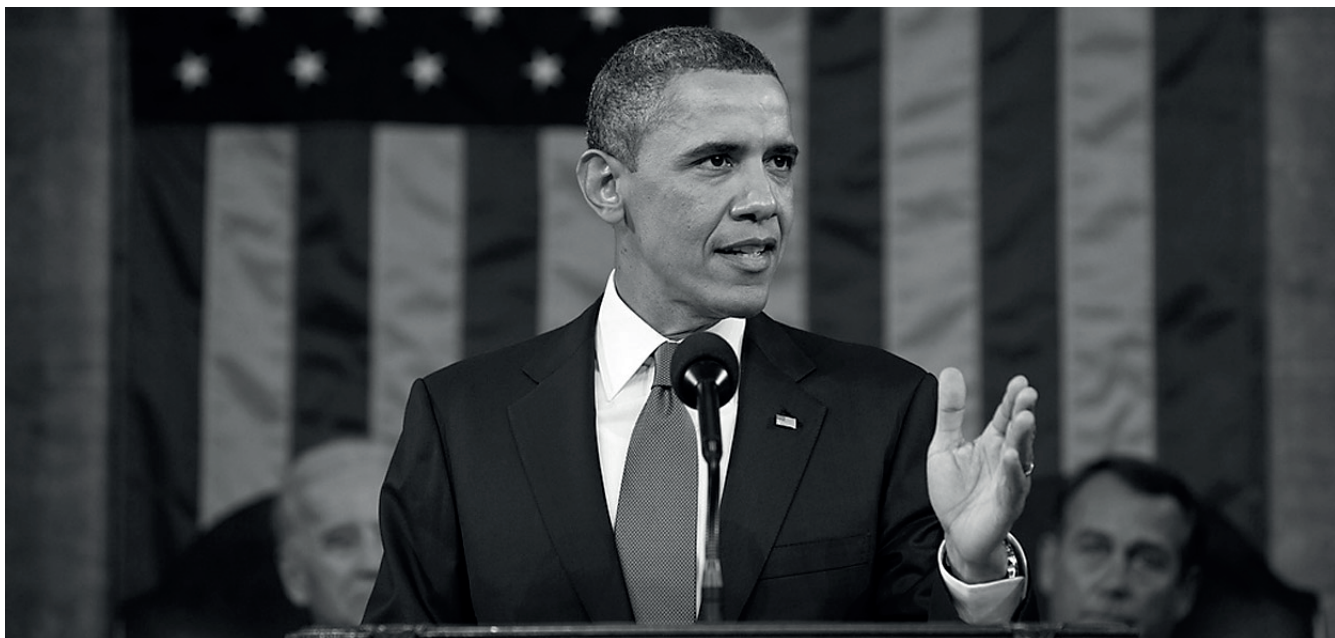
Taluskriisi on varjostanut Barack Obaman presidenttikautta.

(4) Neljäntenä näkökulmana on vahva usko Yhdysvaltojen erityisrooliin suhteessa muuhun maailmaan. Yhdysvaltojen koetaan edustavan vapautta ja muita keskeisiä arvoja, joiden suhteen ei haluta tehdä kompromisseja. Tämä kompromissihaluttomuus heijastuu sekä sisä- että ulkopoliittikkaan. Esimerkiksi teekutsuliikkeen tukema ehdokas Rick Santorum ja osittain myös Newt Gingrich korostavat Yhdysvaltojen olevan valittu kansa, jolla on erityinen velvollisuus levittää omia arvojaan. Keskeiseksi koetaan myös varaukseton tuki Israelille – erityissuhde Israeliin on osaltaan myös sisäpolitiikkaa, koska siinä korostuvat kristillisen oikeiston arvot.