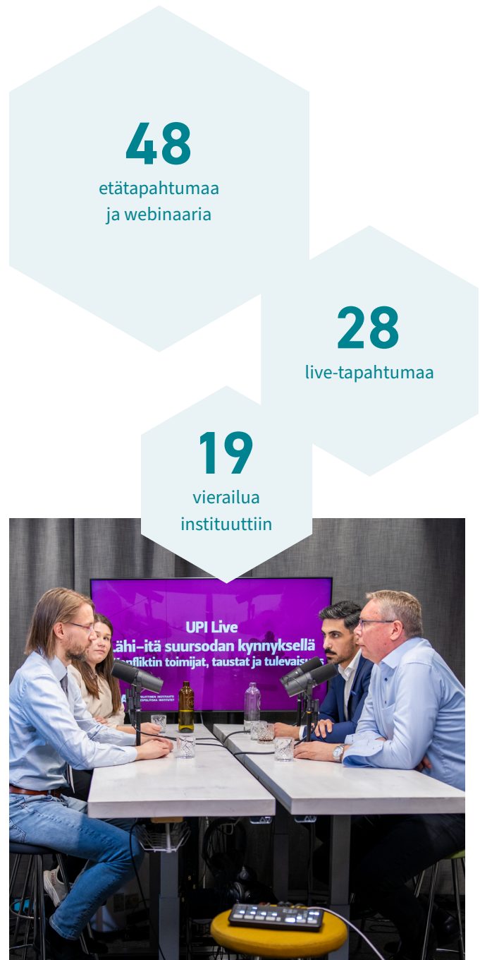
UPI Livessä syvennyttiin vuoden polttaviin teemoihin, kuten Lähi-idän tilanteeseen.

HSF näkyi erityisesti suomalaisissa medioissa. Konferenssissa oli koko viikonlopun ajan paikalla toimittajia Suomen suurimmista mediataloista. Konferenssin asiantuntijoista ja vieraista tehtiin suomalaismedioihin kymmeniä haastatteluja ja artikkeleita. Mediakiinnostus kohdistui erityisesti HSF:n avajaistilaisuuteen, jossa haastateltavana oli tasavallan presidentti Alexander Stubb.