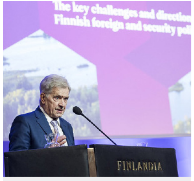
Vuoden 2025 FIIA Forumissa puhui presidentti Sauli Niinistö.

Kesäkuukausina UPI osallistui useisiin merkittäviin yhteiskunnallisiin tapahtumiin Suomessa ja ulkomailla. Instituutti avusti tasavallan presidentin kansliaa Kultaranta-keskustelujen järjestämisessä, jotka palasivat Naantalin Kultarantaan tilojen valmistuttua remontista. Myöhemmin kesäkuussa UPI kutsuttiin järjestämään sivutapahtuma Haagiin NATO Public Forumiin, NATO-huippukokouksen yhteyteen. UPI:n paneelikeskustelu ”Taming the Bear: Countering Russia’s Enduring Threat” oli osa München Security Conferencen ja Clingendaelin isännöimää NATO in the Huis -kokonaisuutta. Lisäksi UPI järjesti SuomiAreenassa