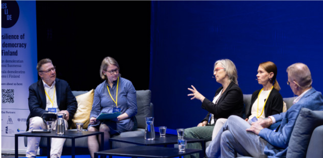
RESLIDE-hankkeen tutkijoita Turun Eurooppa-foorumissa. Kuva: Linda Svarfvar / Eurooppa-foorumi 2025