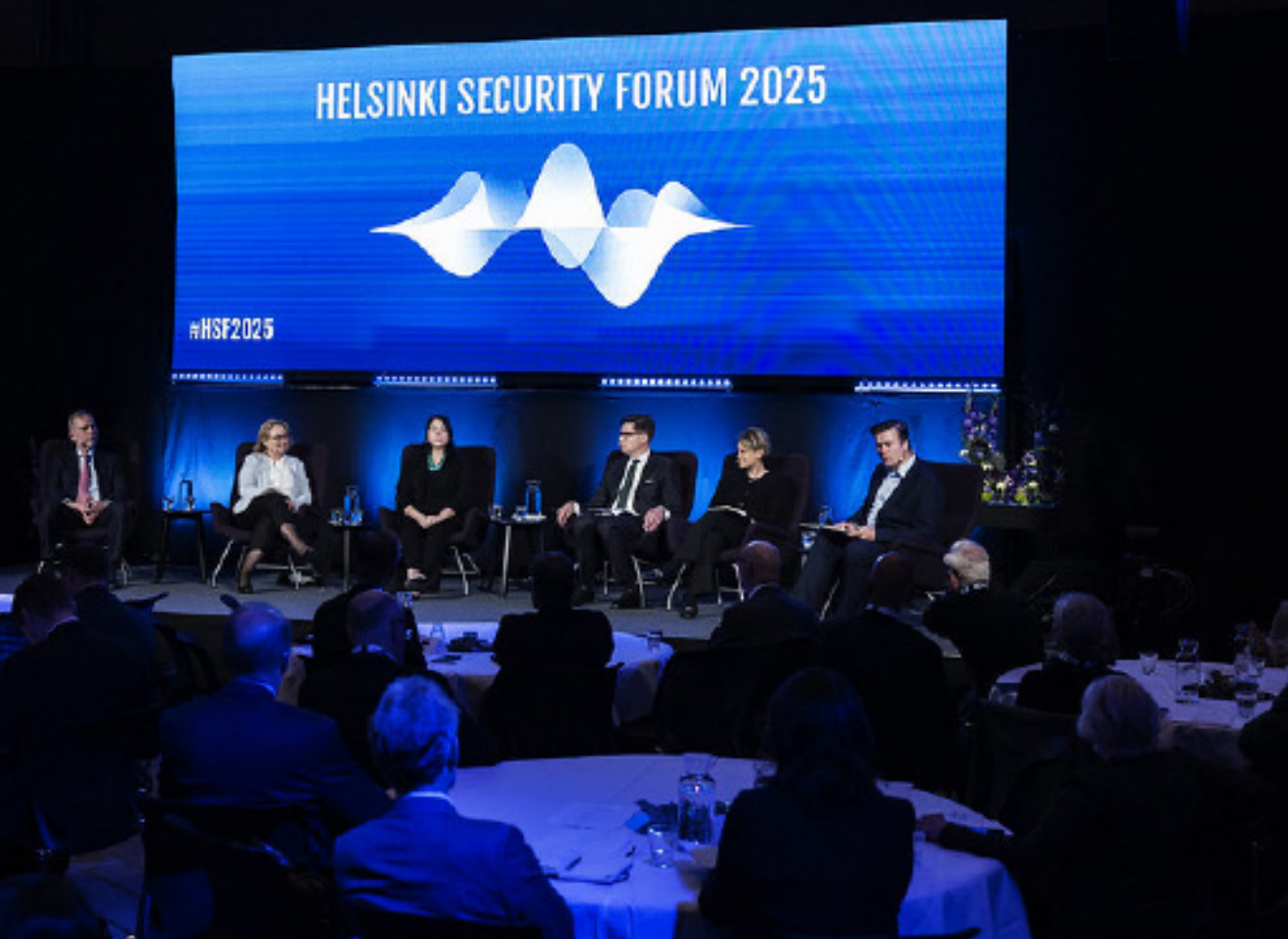
Helsinki Security Forum sai laajaa medianäkyvyyttä sekä kotimaisessa että kansainvälisessä mediassa.

tutkimusohjelma 2025, projektissa Venäjän taloudellinen kantokyky.